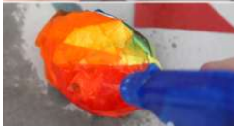
TISSUE PAPER EASTER EGGS